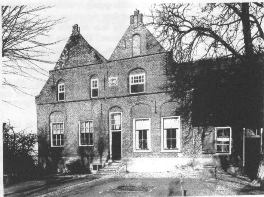
Het voorhuis van Reestein . In het midden boven de voordeur het alliantiewapen.

Deze boerderijen en de afgebroken boerderij Dierenstein behoorden tot hun bezittingen. De verbondenheid in het huwelijk werd bij de adel uitgebeeld in zo'n alliantiewapen. Er staan drie molenijzers op en een zwijnskop.